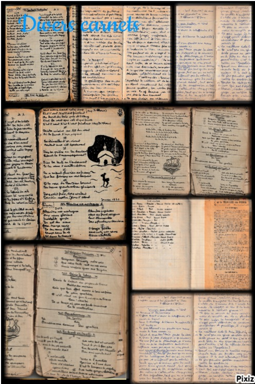
Carnets de Bernard Maître 1939 à 1958

Dans tous les carnets, l'écriture est petite, soignée et la mise en page est maîtrisée. On devine un tempérament calme et posé.